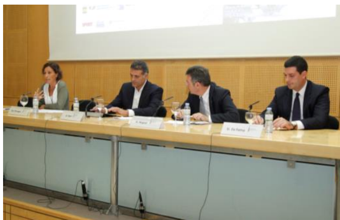
Taula de subseus: moderadora, Terrassa, Banyoles i Castelldefels / Mesa de subseus: moderadora, Terrassa, Banyoles y Castelldefels