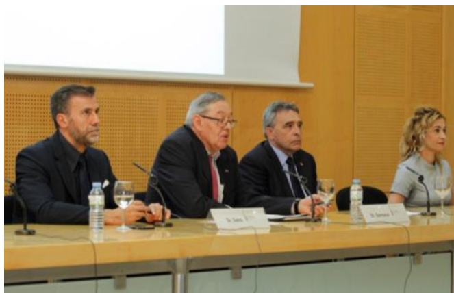
La taula sobre el Pla ADO, amb representació del COE i dos medallistes / La mesa sobre el Plan ADO, con representación del COE y dos medallistas