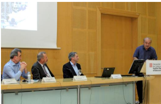
Taula de ciutats olímpiques: 2012, 2004, 1994 i 1992 / Mesa de ciudades olímpicas: 2012, 2004, 1994 y 1992