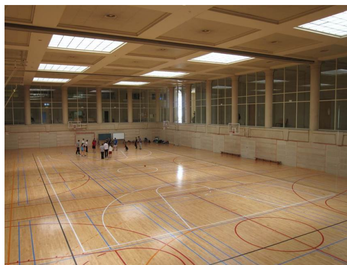
L'INEFC, a l'actualitat / El INEFC, en la actualidad